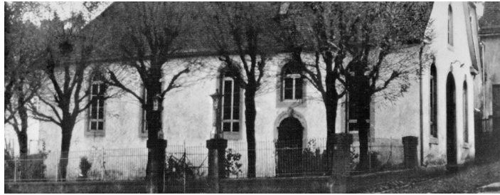
Ehemalige Jüdische Synagoge

www.staedte-fotos.de , gedenkstaetten-uebersicht.de , gesh.bfnm.co/de , www.zollernalb.com