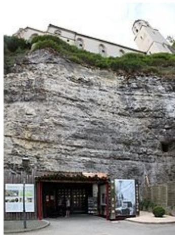
Felsen mit Schlosskirche und Atomkellermuseum

* Änderungen nicht vorgesehen, aber vorbehalten